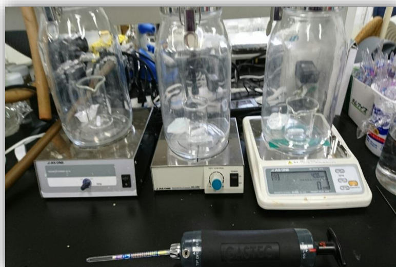
< 実験写真 >